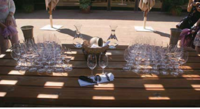
上图从左至右: 1.21岁以上同学们开心的享受葡萄酒 2.静待我们品尝的葡萄酒