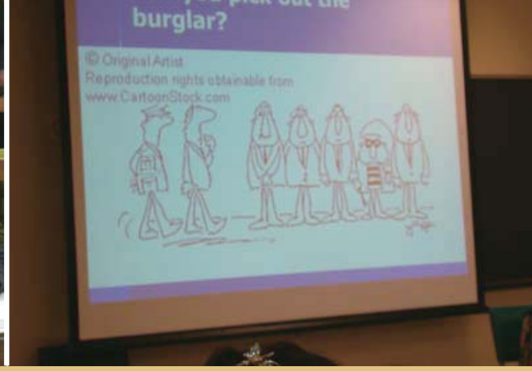
左图:院长欢迎我们的到来 中图: 我很享受在这里的每一堂课 右图:形式多样的ppt