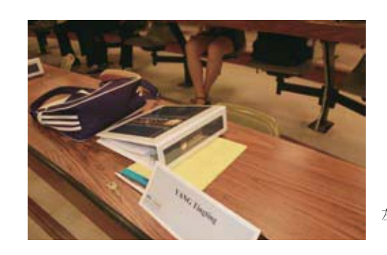
E图: 厚厚的讲义夹,三周后全者 塞满了课前预习的材料